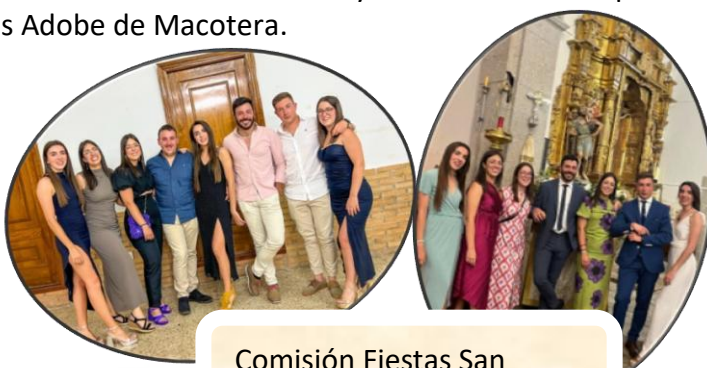
Comisión Fiestas San Cristóbal 2024.

El día 10, día grande de la fiesta, se inauguró con la salida de la Comisión de Fiestas y autoridades desde el Ayuntamiento acompañados por el Grupo de dulzaineros Adobe de Macotera.