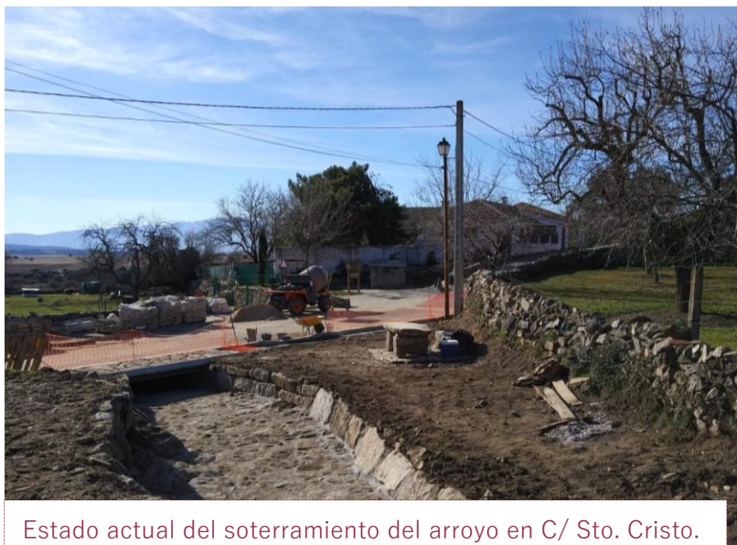
Estado actual del soterramiento del arroyo en C/ Sto. Cristo.

El pasado 27 de diciembre se celebró la sesión periódica bimensual de Pleno ordinario .