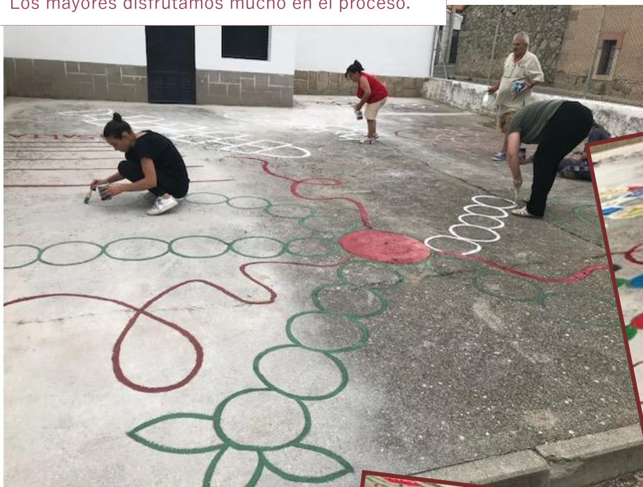
Los mayores disfrutamos mucho en el proceso.