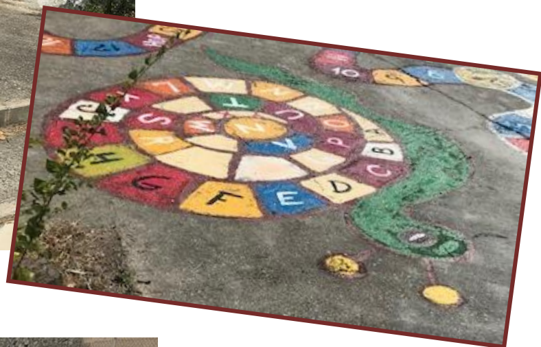
Una de las zonas que se ha renovado.