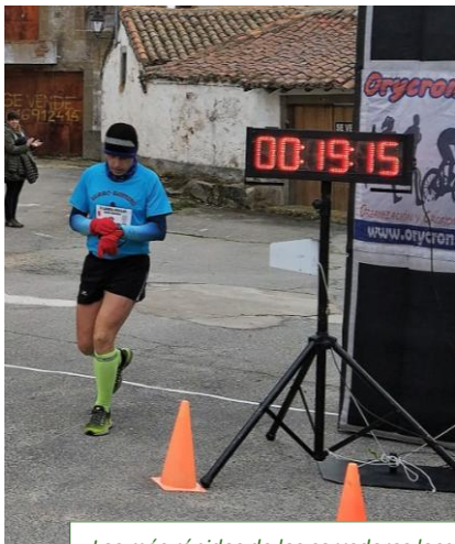
Los más rápidos de los corredores locales