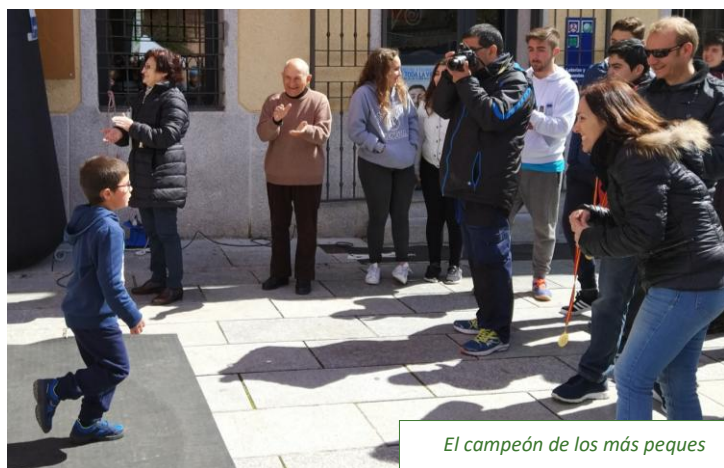
El campeón de los más peques