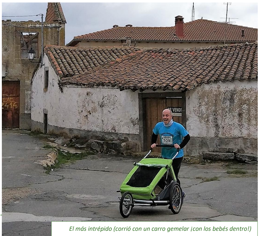
El más intrépido (corrió con un carro gemelar ¡con los bebés dentro!)