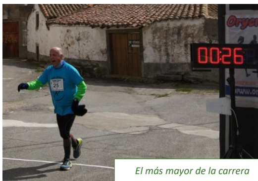
El más mayor de la carrera