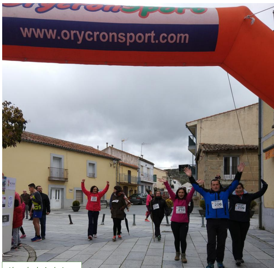
Llegada de Andarines