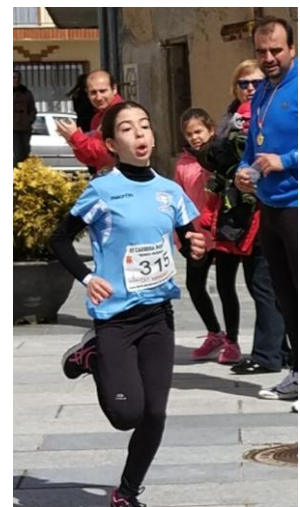
La ganadora de los mayores