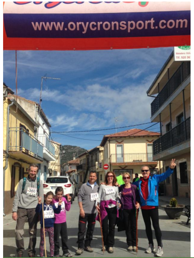
Los primeros Andarines que llegaron a la meta. El resto optó por entrar en grupo formando un animado pelotón.