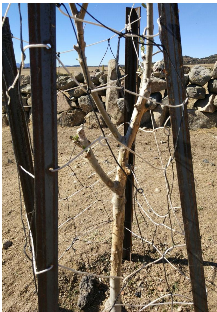
Han devorado los brotes, las ramas y lo han intentado con el tronco.

retoños varias veces. También se han dado otros casos de destrozos, generalmente involuntarios, y minoritariamente. Así que es imperativo que entre todos cuidemos de ellos, pues es nuestro patrimonio, como parte del Medio Ambiente en general. Y concretamente en este caso, está en juego un gran esfuerzo por parte de un grupo de personas que trabaja mucho durante todo el año, y el dinero de muchas otras que han apostado por este proyecto con ilusión.