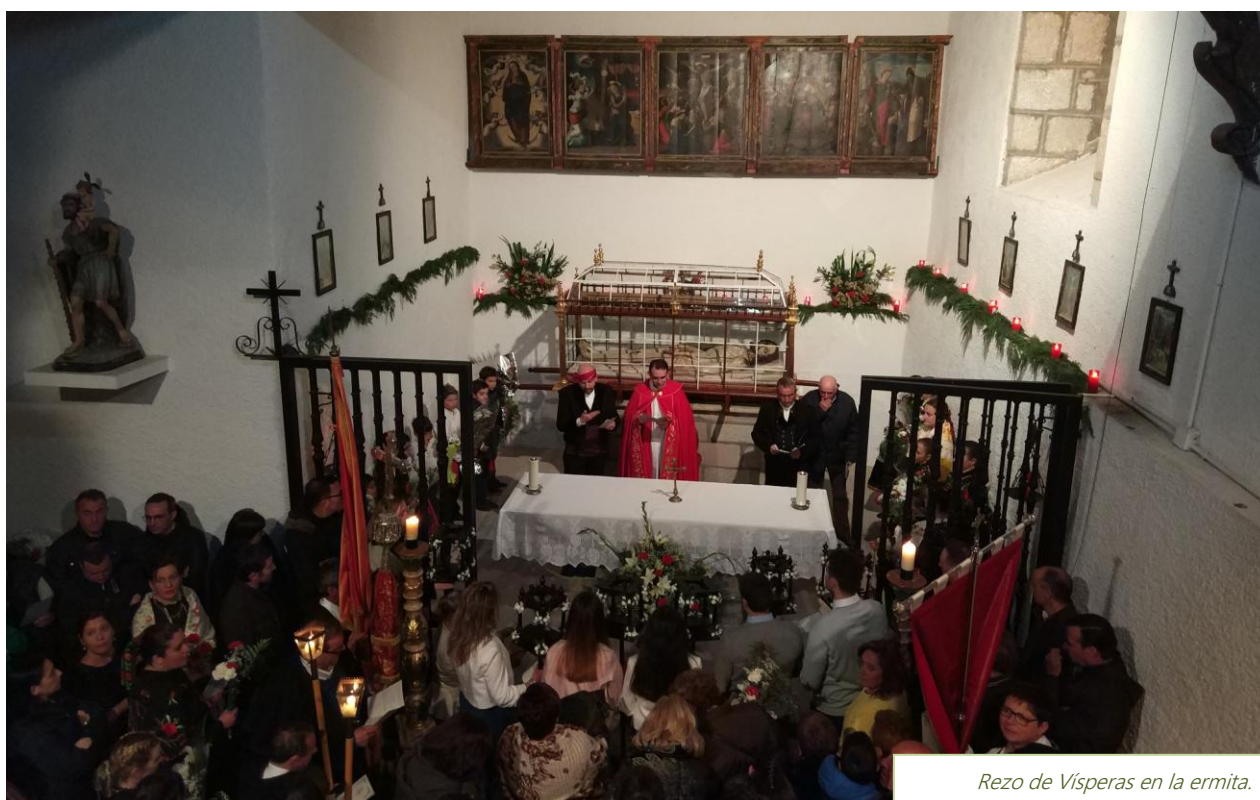
Rezo de Vísperas en la ermita.