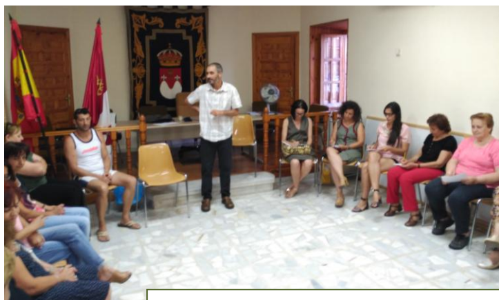
Taller sobre Salud Emocional el 19 de agosto.

En esta segunda mitad del mes también ha habido multitud de planes de toda clase para entretener el tiempo a la vez que aprender algo. Así, ha continuado el ciclo de conferencias saludables, ha habido ruta senderista nocturna, cenas y bailes. Veamos una selección de imágenes.