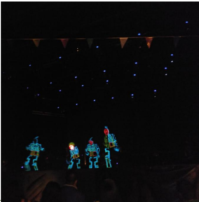
Espectáculo de la orquesta Jamaica en la noche del viernes.