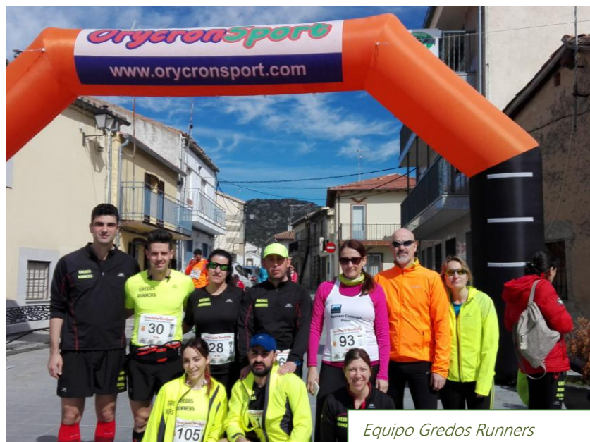
Equipo Gredos Runners

Por último, se sirvió la paella (como siempre, riquísima). El balance , tanto para la organización como para el pueblo en general, ha sido más que positivo así que no nos queda más que agradecer a todas aquellas personas que han trabajado o participado de una u otra forma en que así fuera.