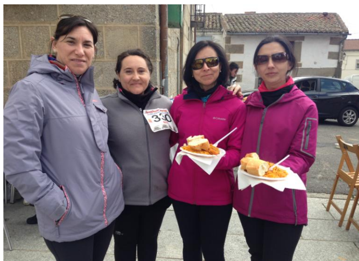
Parte del equipo organizador y de cocineros. ¡Merecido descanso!