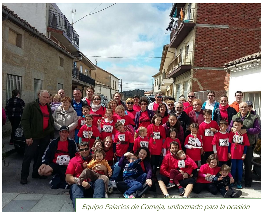
Equipo Palacios de Corneja, uniformado para la ocasión