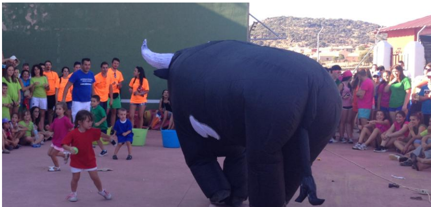
La prueba infantil, fuera de concurso, fue también muy divertida.

Participaron seis equipos en pruebas de fuerza, maña o velocidad, y resultó ganador el equipo de la Peña del Tó. Además de un sinfín de arañazos y moratones que llevaron todos los participantes como recuerdo hay que destacar un par de lesionados que pasarán el verano en reposo. ¡Ánimo!. Y así terminamos las fiestas de San Cristóbal 2015.