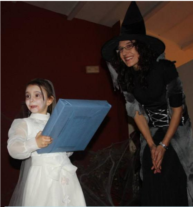
Ganadora del concurso infantil.