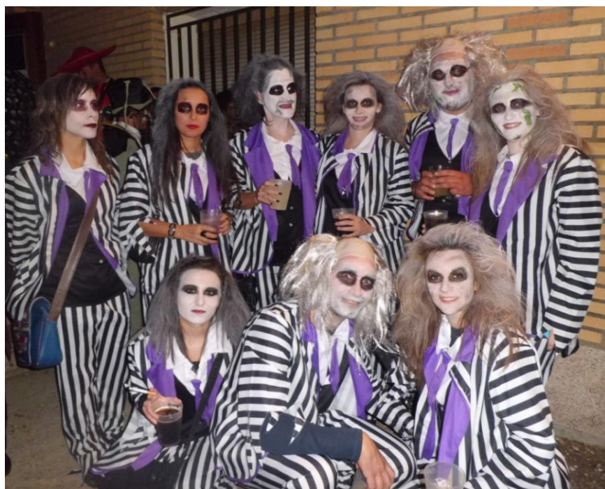
Ganadores de los concursos de disfraces de adultos, individual y en grupo.