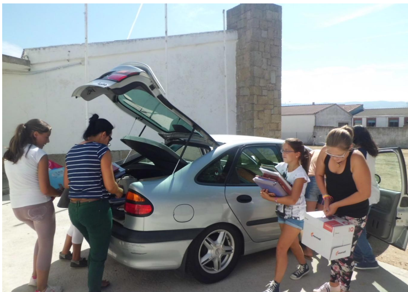
Las alumnas que este curso dejan nuestro cole para comenzar el instituto en Piedrahíta ayudan a la directora con la mudanza del material del centro de Diego Álvaro.