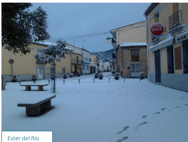
Ester del Río