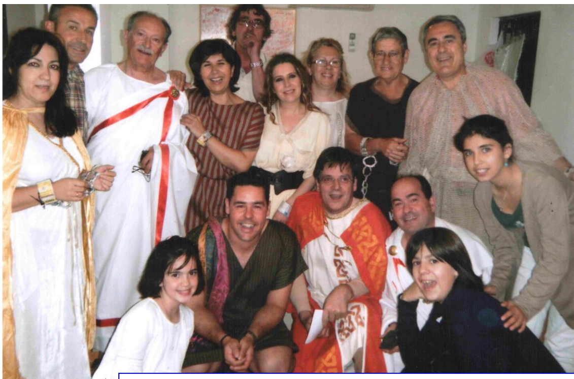
Integrantes de Primavera en el corazón tras su última representación teatral.

El próximo domingo , a las 17'00 h. representaremos en el salón cultural de Santa María del