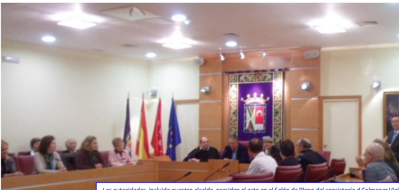
Las autoridades, incluido nuestro alcalde, presiden el acto en el Salón de Pleno del consistorio d Colmenar Viejo.