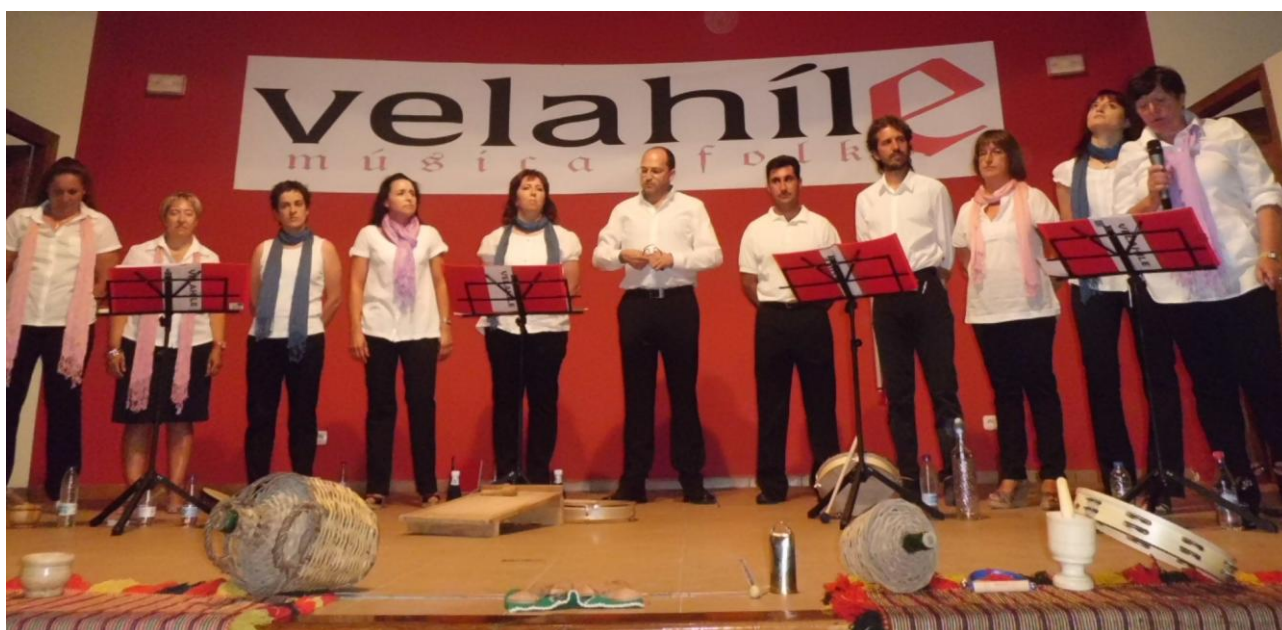
Imagen de archivo: concierto agosto 2011