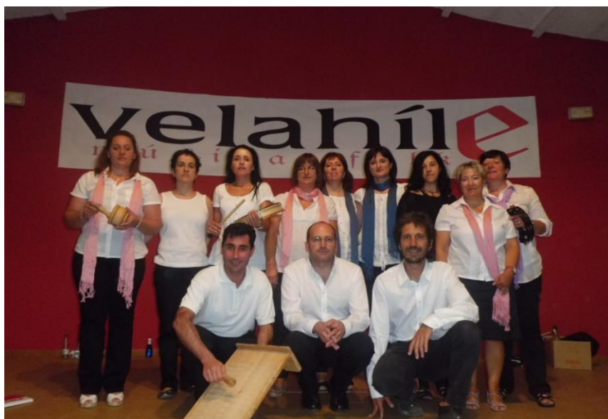
Algunos de los componentes del grupo Velahíle.