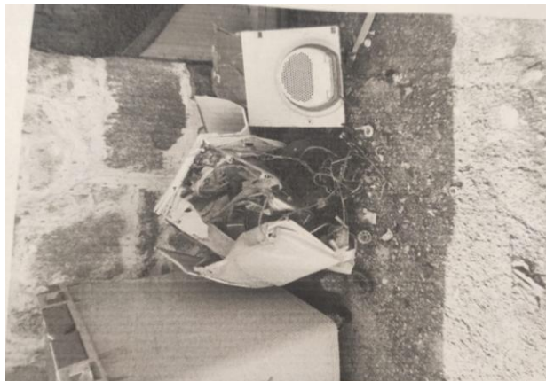
Fotografía nº 1 Se observan electrodomésticos al lado del contenedor

Prueba gráfica que consta en la denuncia.