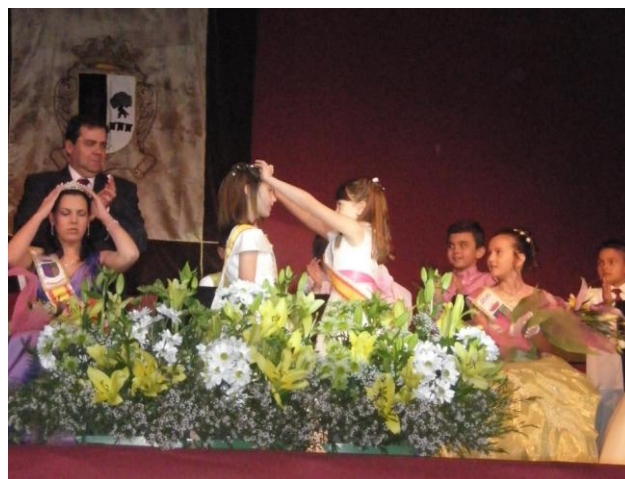
Coronación de Romeras y Damas de Honor Infantil y Juvenil.