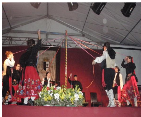
También hubo una muestra del folclore popular.