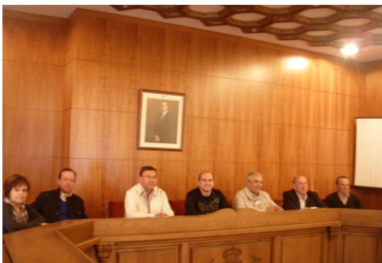
Representantes de tres de los municipios en el Salón de Plenos del consistorio anfitrión.