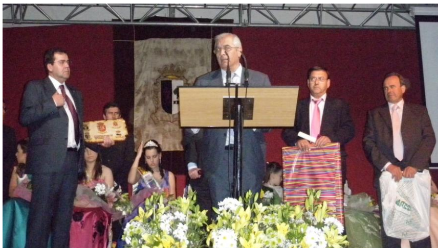
Parte de la delegación de Navahermosa de Beas (Huelva). A la derecha, el alcalde de Navahermosa en Sierra de Yeguas, Málaga.