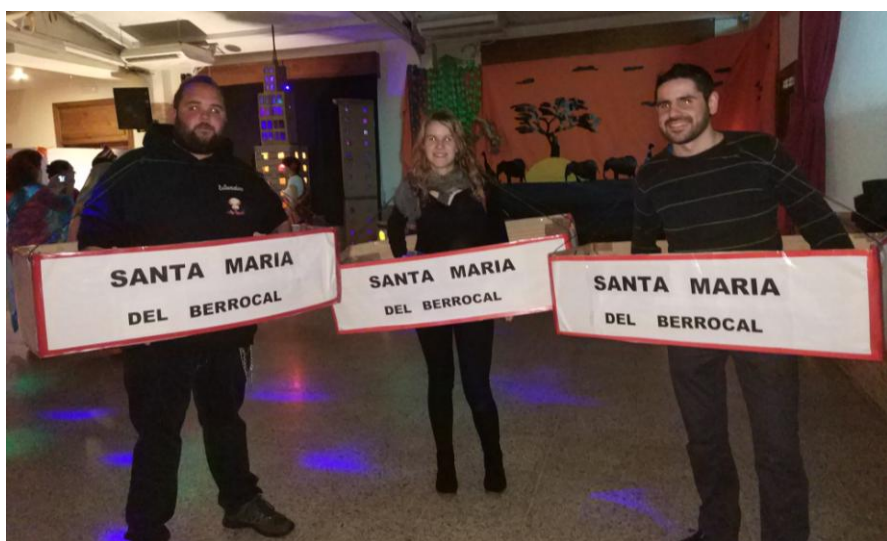
Empezamos la vuelta al mundo en nuestra localidad.

Los mayores tuvimos la propuesta de viajar con la asociación cultural ACASA alrededor del mundo en la fiesta de la noche del sábado en el TeleClub.