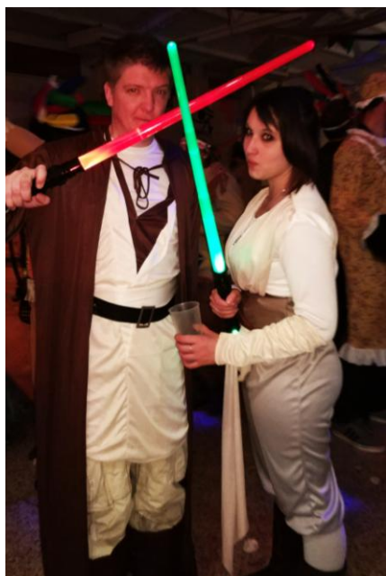
En una galaxia muy lejana...