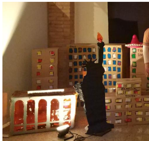
Hasta un barrio de Manhattan, con la Trump Tower, la Berrocal Tower y altos rascacielos.