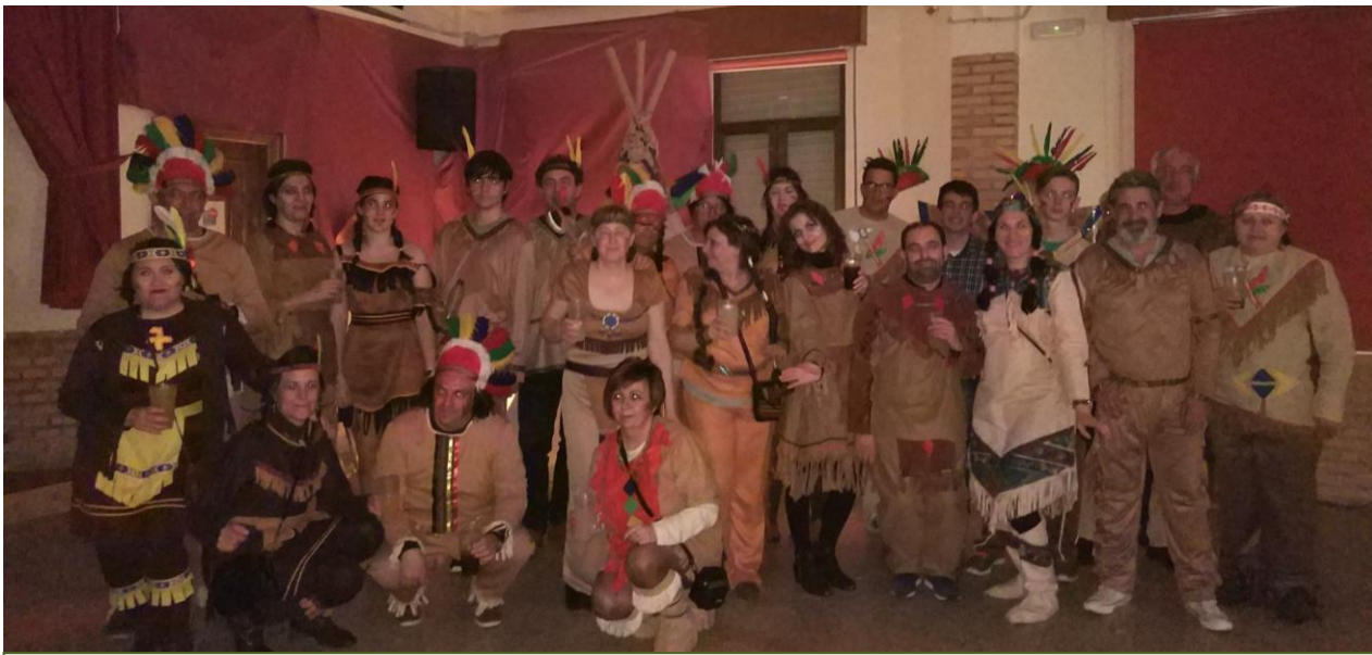
Y numerosas tribus de indios, con tipi y cabellera cortada incluidos. Y un rincón de África para hacer safaris.